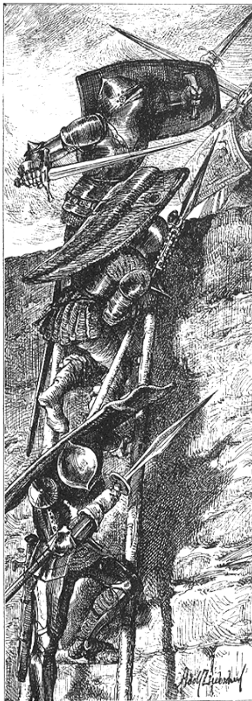
Dobývání hradu způsobem obyčejným pomocí žebříkův.